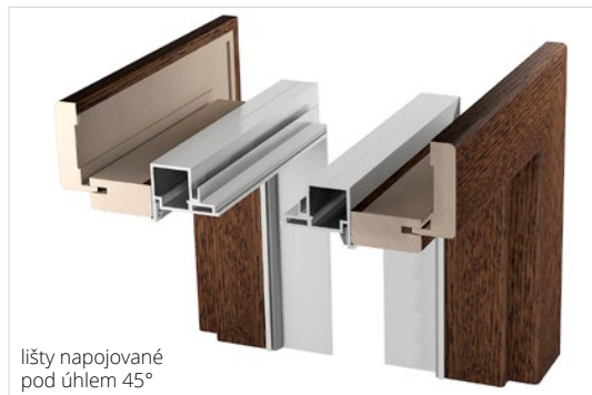
lišty napojované pod úhlem 45°